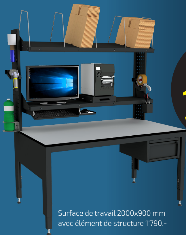
Surface de travail 2000x900 mm avec élément de structure 1'790.-

Fabriqué en tôle d'acier robuste, PackLine Smart offre une longue durée de vie. Disponible en kit en deux tailles, avec ou sans étagères, elle est prête à l'emploi. La table d'emballage est montée et prête à l'emploi en un tour de main. Une vaste gamme d'accessoires complète l'offre.